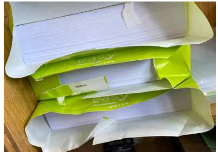
Mit dem digitalen Büro verschwinden in Zukunft Papierberge.

Erhalten Landwirte vom Agrarhändler eine PDF-Rechnung per E-Mail, so ist nur die PDF-Rechnung das Originalformat und dieses muss zehn Jahre in seiner Ori-